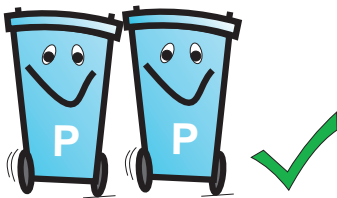
Papier / Papier