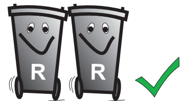
Restmüll / Restmüll