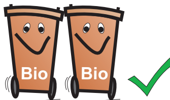
Bio / Bio