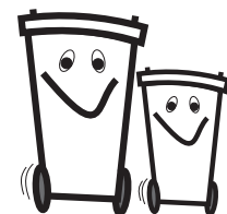
große Tonne / kleine Tonne

Gemischte Abfalltonnen-Pärchen sind unerwünscht , da sie nicht zusammen ins Fahrzeug kommen dürfen.